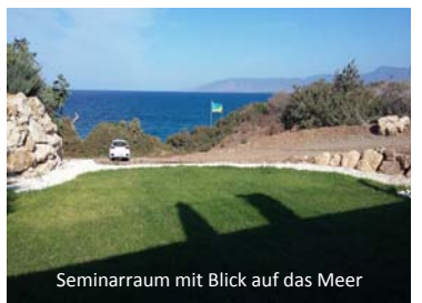
Seminarraum mit Blick auf das Meer